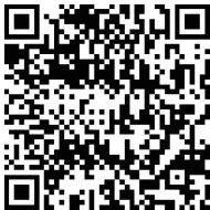
M-Z 6Bit 教学视频